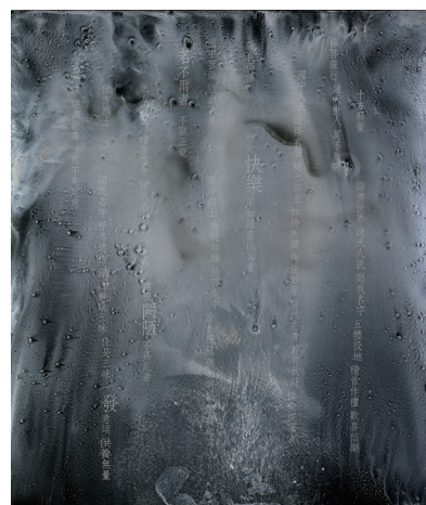
鳥山玲 「観無量寿経—願文七—」F20 ミクストメディア(有保和紙・金属泥粉・墨・煤)