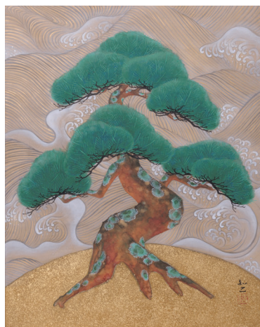
森山知己 「松 Let's dance」91.0×72.7cm/F30 胡粉・岩絵具・墨・金箔・金泥/和紙