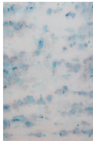
斉藤典彦 「WL-015」91.0×60.6cm/M30 絹・岩絵具・顔料・金属泥・膠