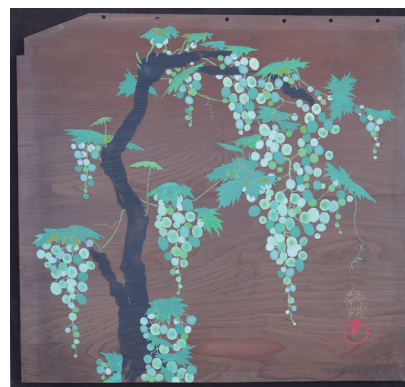
八木幾朗 「葡萄・豊作」62×63cm変形 岩絵具・墨・金泥/板