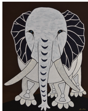
河嶋淳司 「白象」F30 岩絵具・胡粉・銀箔/雲肌麻紙