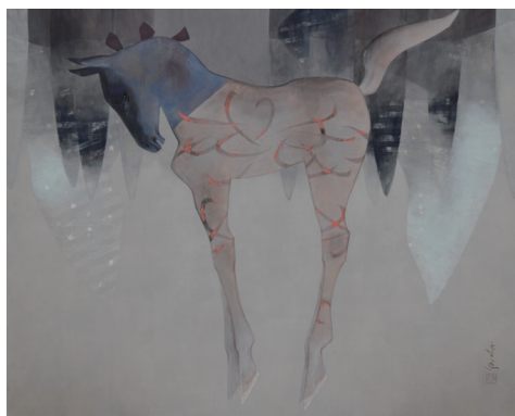
北田克己 「風のこと」F30 岩絵具・膠/楮紙