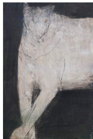
岡村桂三郎 「白狼24-n1」M30 岩絵具/帆布