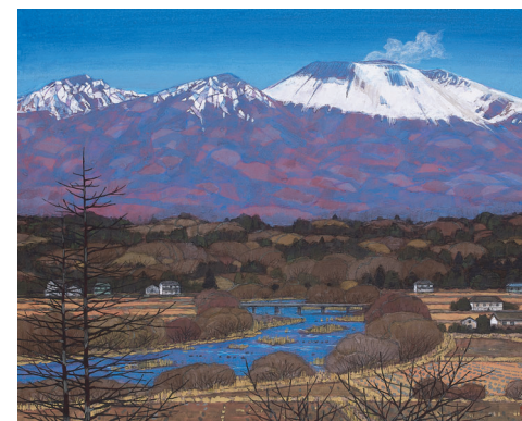
柳沢正人 「浅間朝暁」F30 岩絵具/麻紙