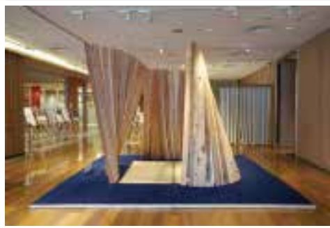
2022年最優秀賞「秋の木」 広島大学大学院 / 広島大学

今年も、銀座三越 9階 銀座テラスで、2023年の最優秀作品を原寸大で設計・施工し、実際に茶席として使用する予定です。学生ならではのオリジナリティあふれる茶席空間をお楽しみください。